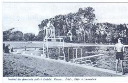
Freibad der Gemeinde Hüls i. Krebbl. Baue-, Bild-, Bild- u. Schwimm

Der Heimatverein Hüls zeigte in den Heimatstuben eine Fotoausstellung zum Thema „Hülser Freibad – ein Stück Heimat“, die auf großes Interesse stieß.