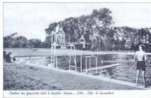
Freibad der Gemeinde Hüls b. Neufels, Kaiser-, Bild., 1911. v. Janssen

Der Heimatverein Hüls zeigte in den Heimatstuben eine Fotoausstellung zum Thema „Hülser Freibad – ein Stück Heimat“, die auf großes Interesse stieß.